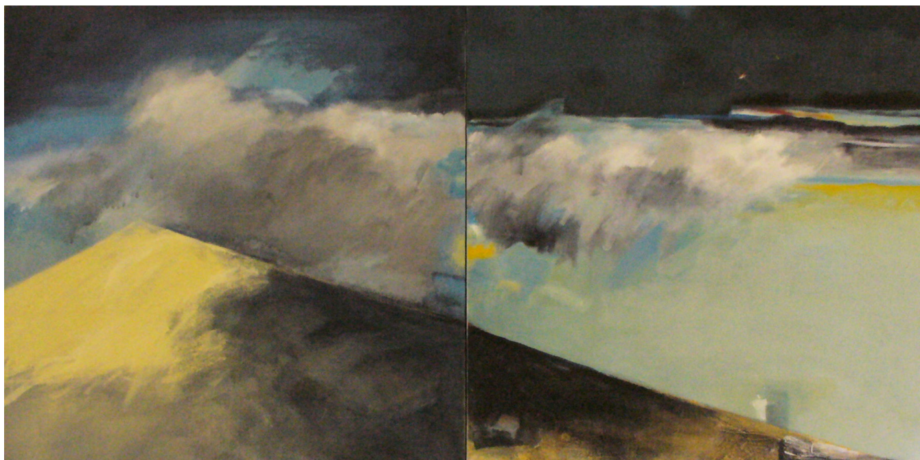
Serie Espacios . Acrílico sobre tela. Díptico 50 X 100 cms. 2010