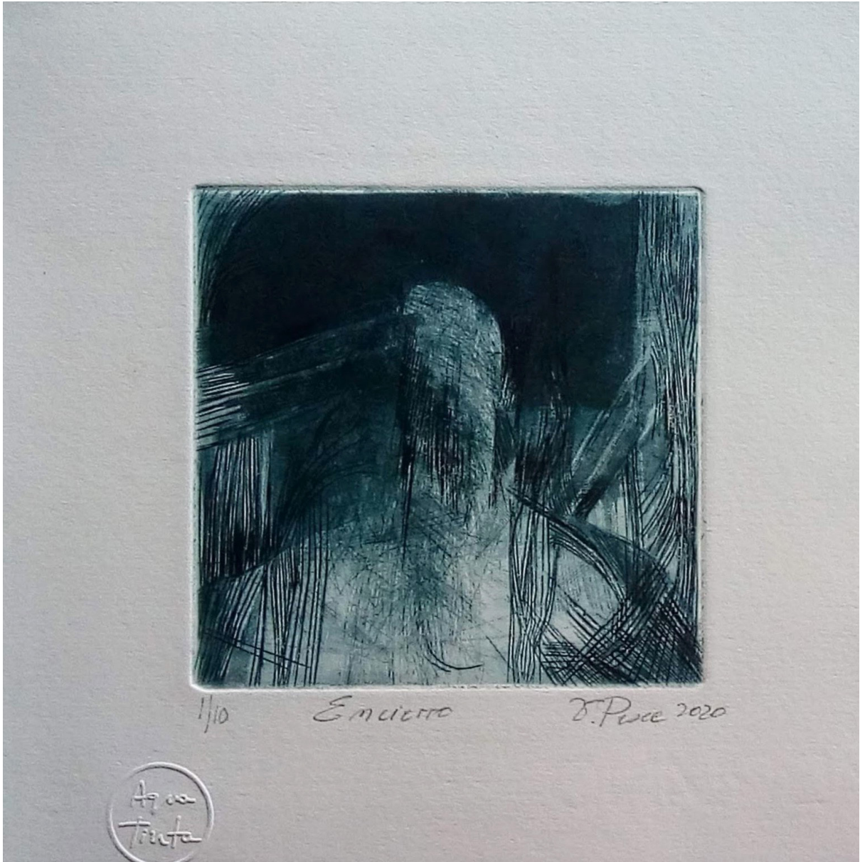
Encierro . Grabado en metal (buril y aguatinta) 10 x 10 cms. sobre 20 x 20 cms. 2020