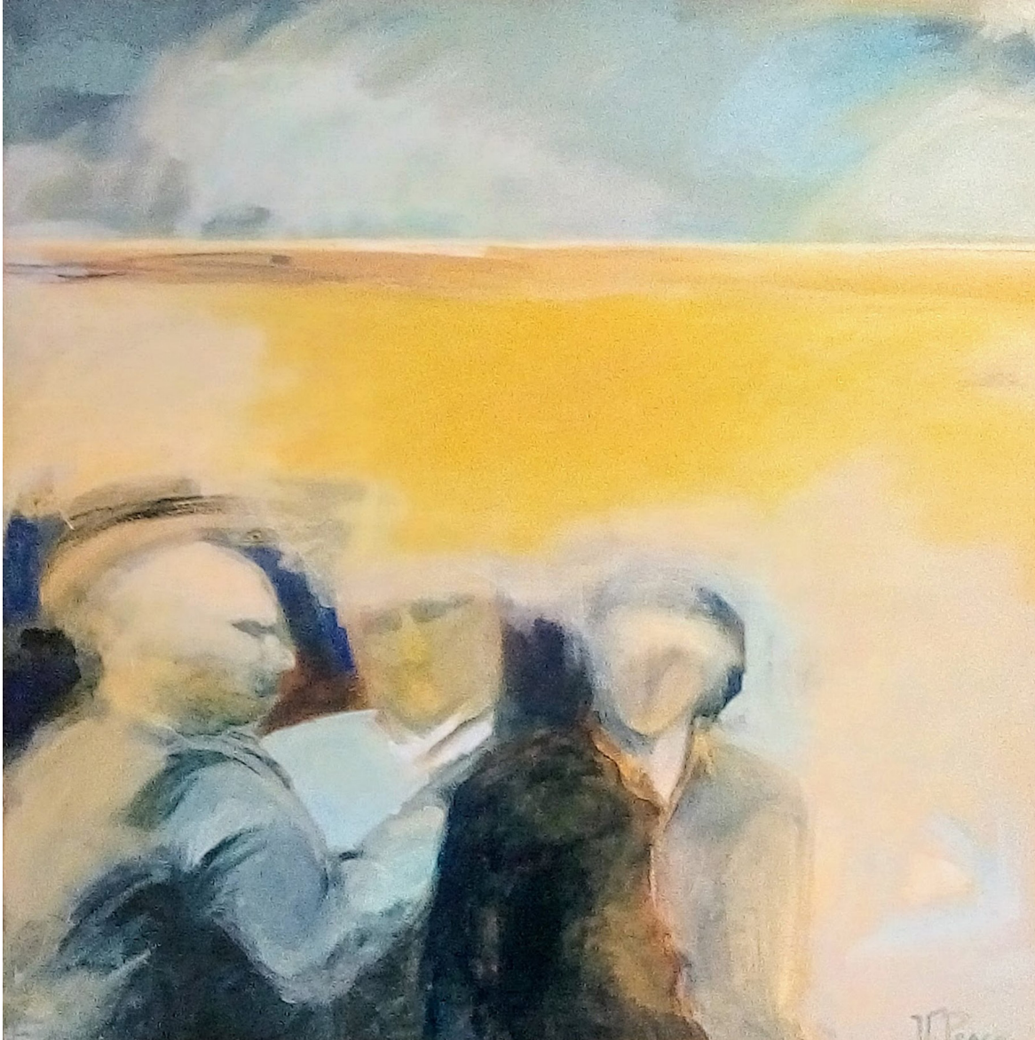
Serie Ausencias . Acrílico sobre tela. 100 x 100 cms. 2004