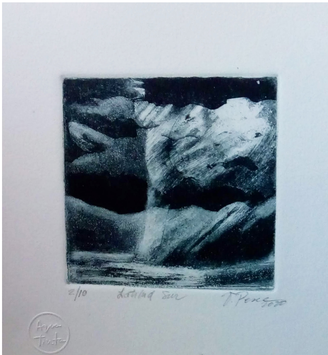
Latitud Sur . Grabado en metal (aguatinta) 10 x 10 cms. sobre 20 x 20 cms. 2020 Premio Miniprint Taller La Rueda - Quito, Ecuador. 2021.