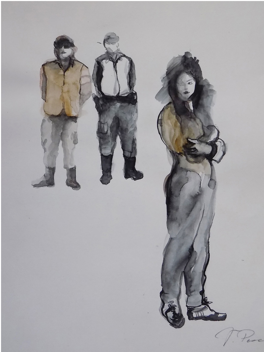
Serie Desconocidos . Dibujo. Tinta sobre papel (aguada) 20 x 25 cms. 2019