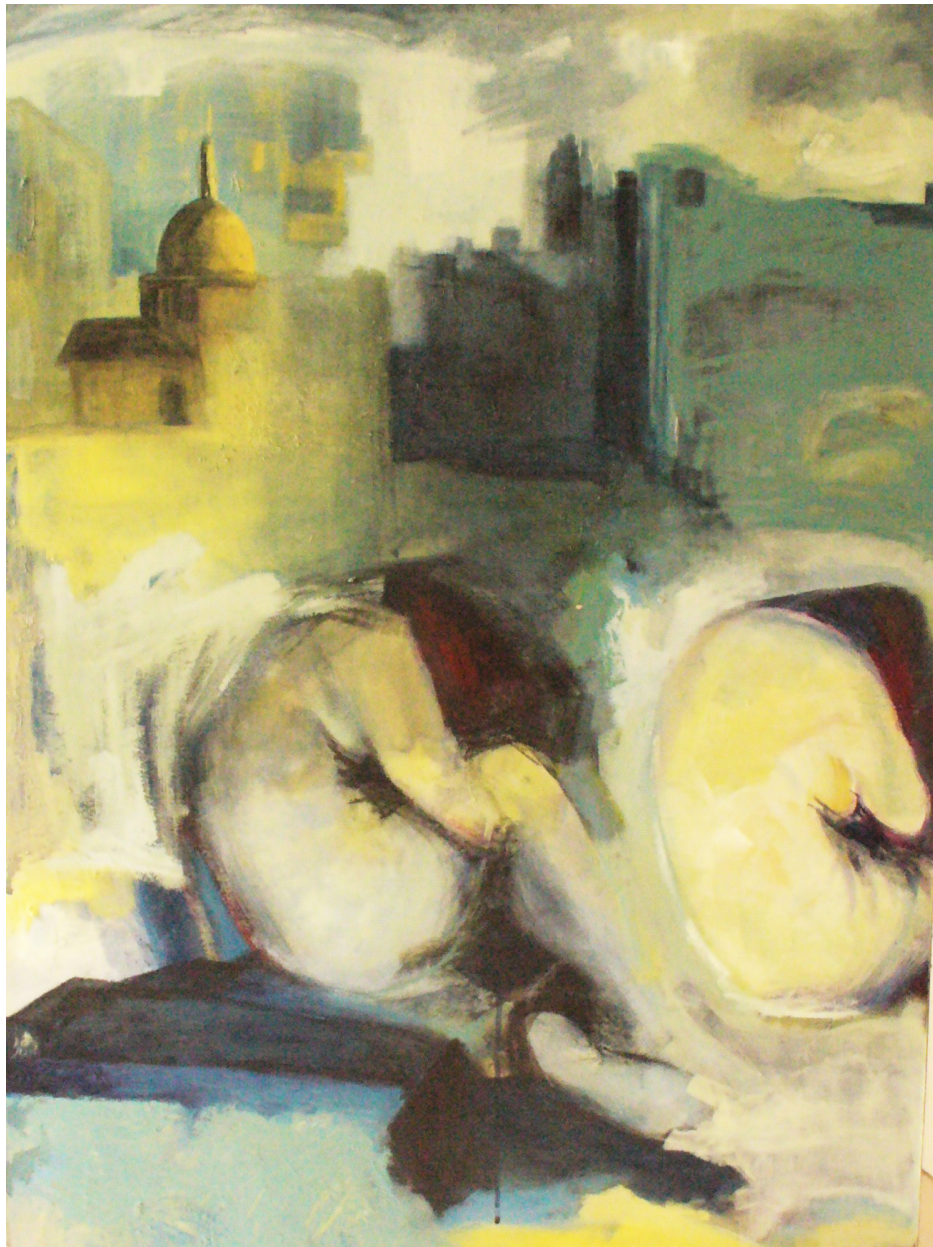
Serie Desnudos . Acrílico sobre tela. 70 X 100 cms. 2004