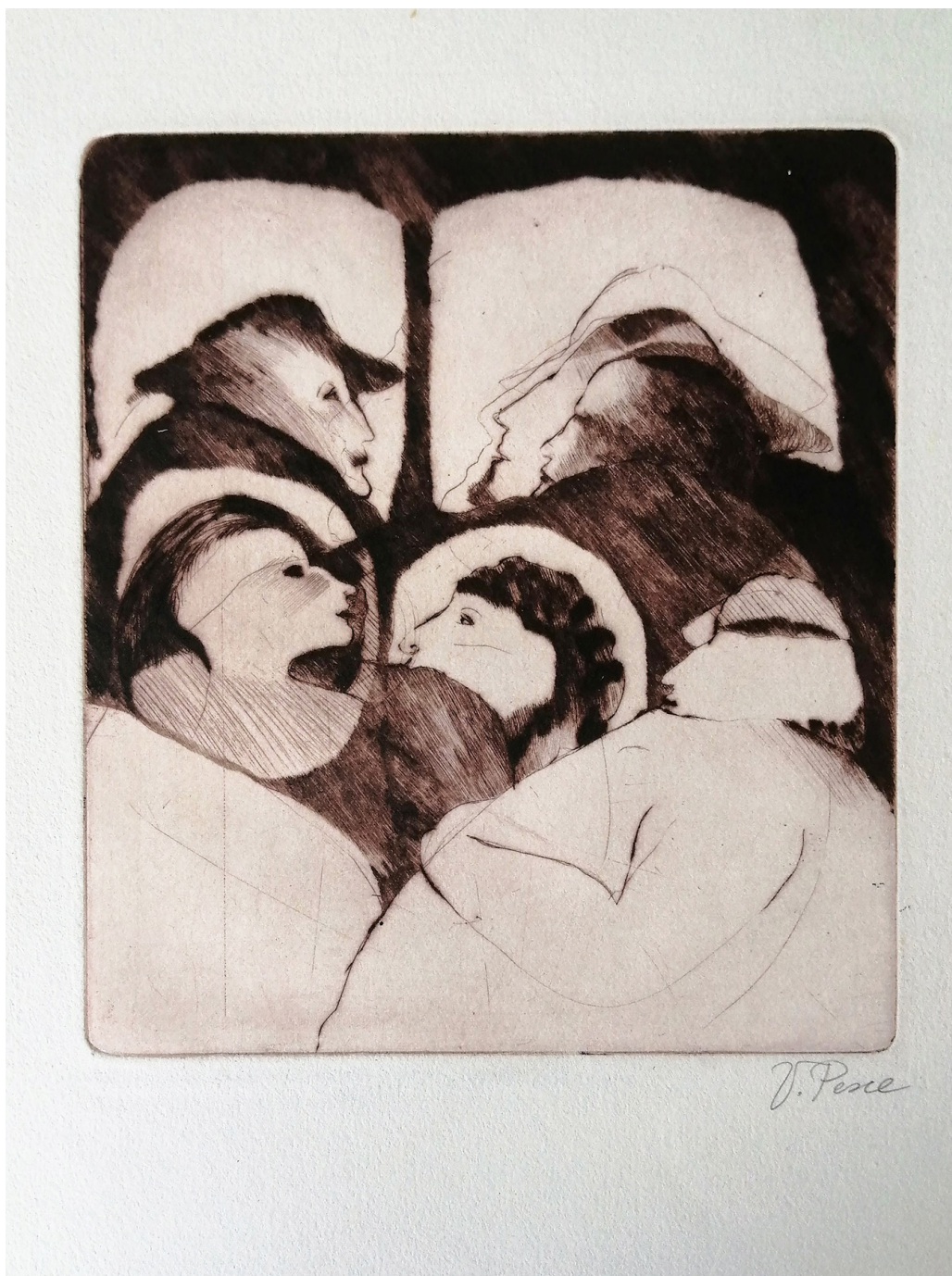
Personajes. Grabado en metal (punta seca) 16 x 19 cms. sobre 28 x 38 cms. 1983