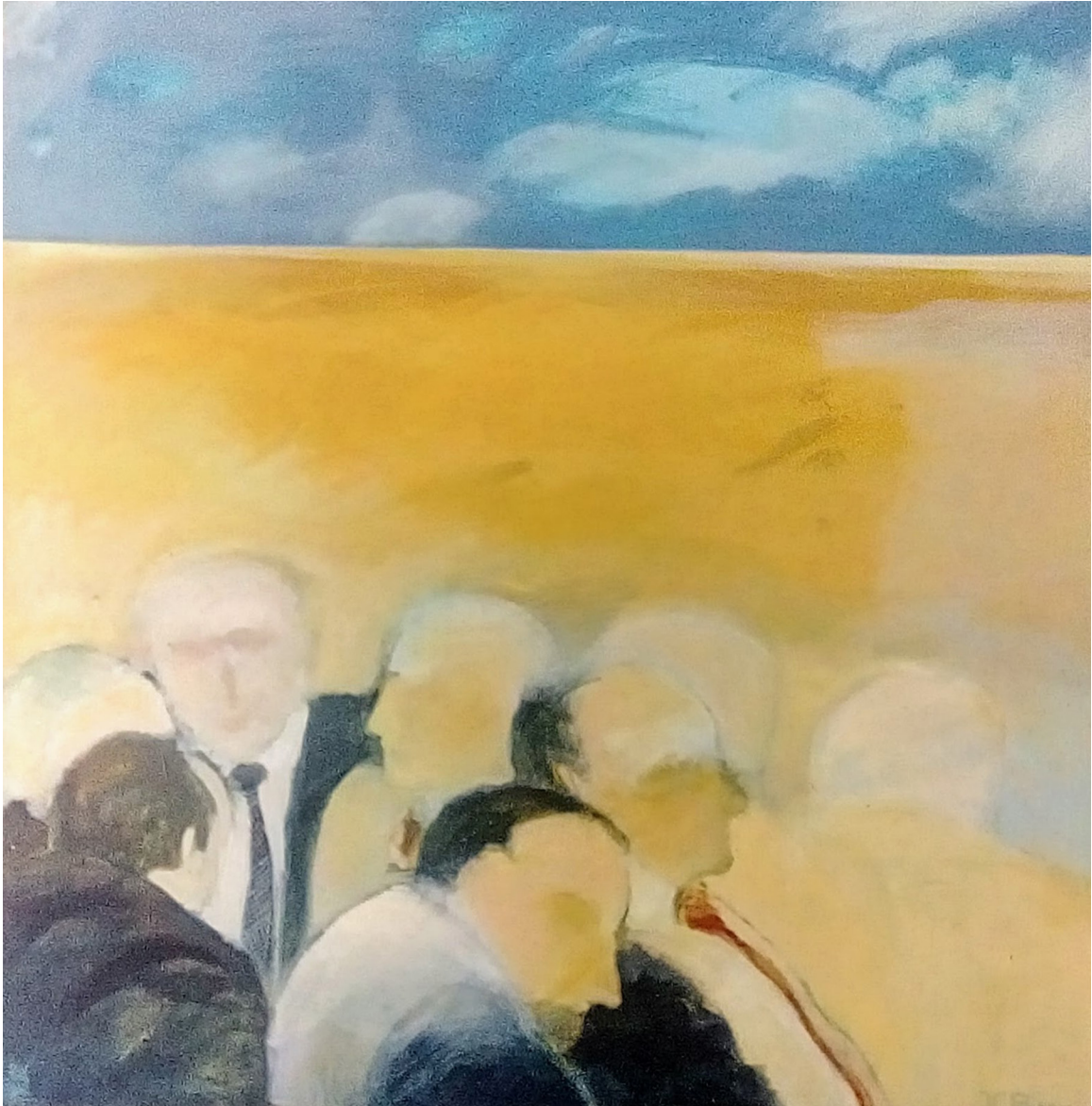
Serie Ausencias . Acrílico sobre tela. 100 x 100 cms. 2004