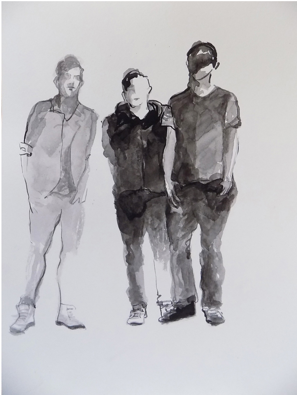
Serie Desconocidos . Dibujo. Tinta sobre papel (aguada) 20 x 25 cms. 2019