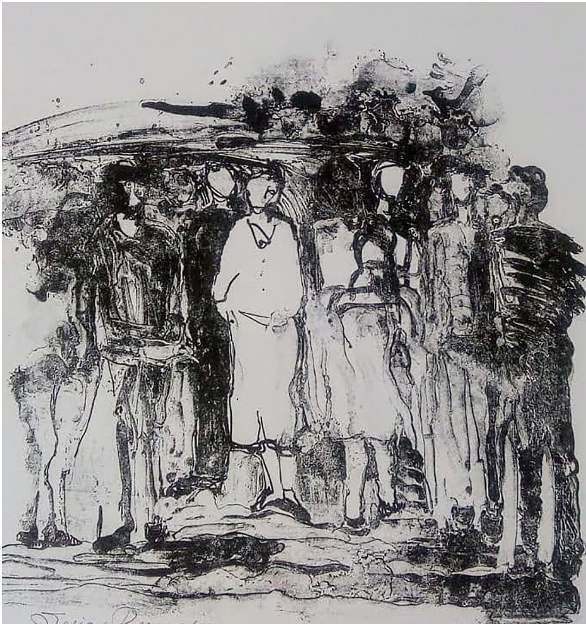
Serie Desconocidos . Técnica Waterless. 35 x 50 cms. 2018