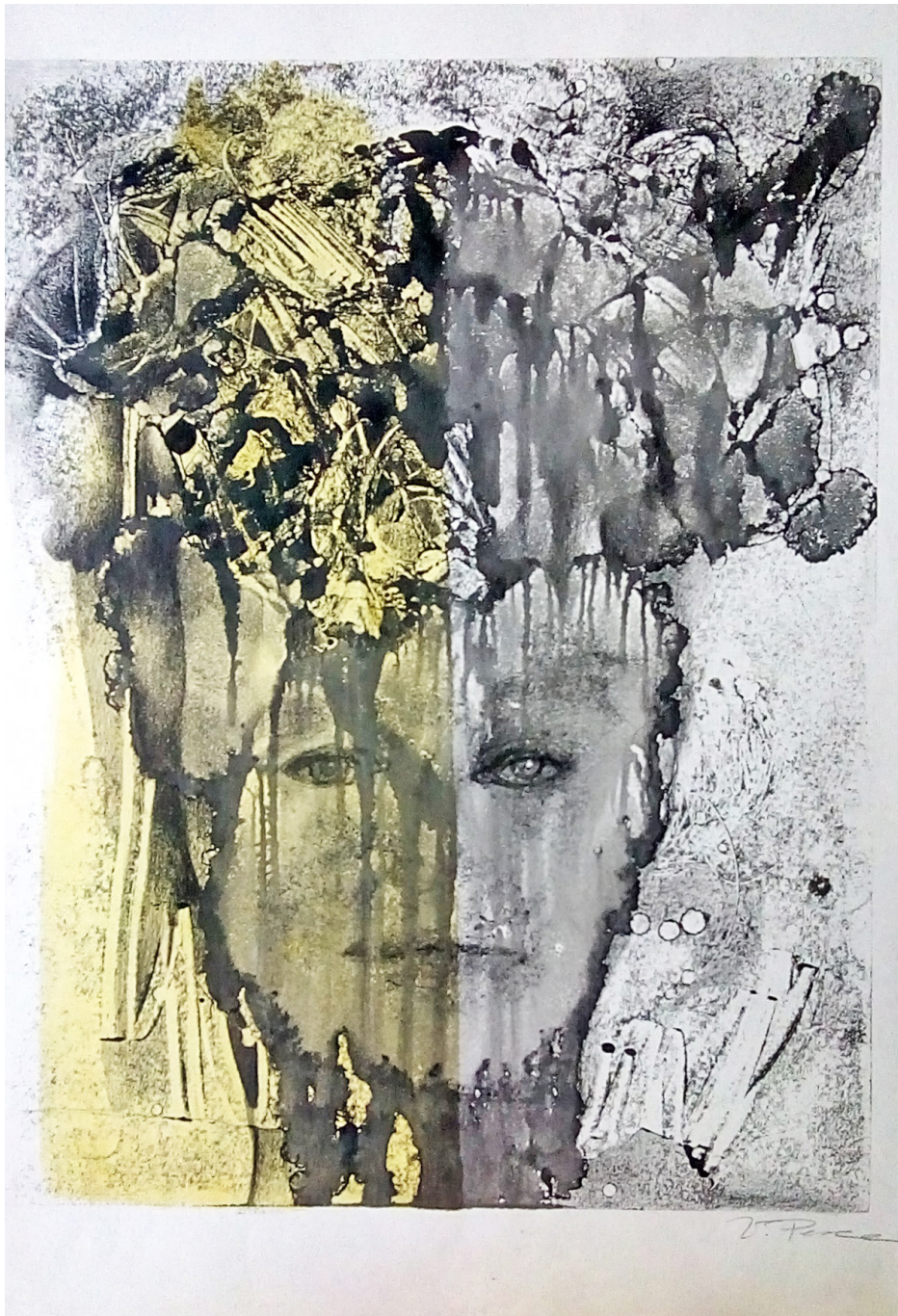
Sin título. Monotipia. 35 x 50 cms. 2018